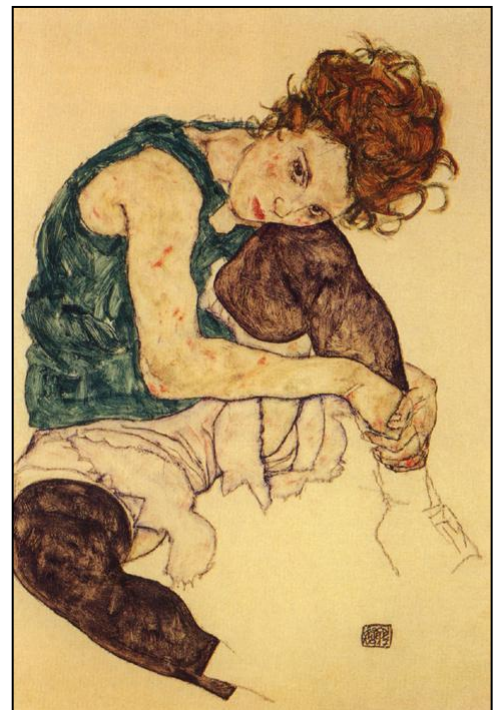
Egon Schiele: Pige med løftet knæ. 1917