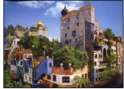
Hundertwasserhaus i Wien

En foredragsrække for den, der gerne vil have mest muligt ud af en rejse til Wien – en by, som er nem at komme til med tog, bil, fly.