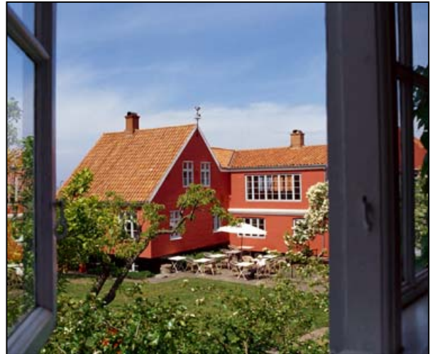
Oluf Høst 1884-1966: Orion og lyse skyer. (1921). Oluf Høst Museet ved forårstid

Herfra kører vi til Hasle røgeri, der ligger med en storslået udsigt over Østersøen, og vi vil her spise en let frokost bestående af røget fisk. Men vi skal ikke have ødelagt vores appetit med det store måltid, for efter besøg i Rønne på Hjorths Fabrik – det berømte keramiske værksted grundlagt 1859 og i dag arbejdende museum – kører vi sidst på eftermiddagen mod Østermarie, hvor Fru Petersens Café byder på det mest overdådige og appetitlige, hjemmelavede ta'-selv kaffebord i et morsomt spraglet interiør eller den hyggelige have. Hvis appetitten kommer igen denne aften, må man selv finde sig et listigt sted i Svaneke's hyggelige smågader, hvor især Svaneke Bryghus' dejlige øller og spisekort kan anbefales. For de interesserede kan der arrangeres en aftenbustur til Hammershus borgruin i på nordøen, hvor vi vil nyde forårsaftenlyset i de historiske omgivelser.