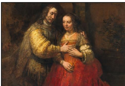
Rembrandt: Jødebruden. Ca. 1666. Rijksmuseum

og de gamle mestre i det nyligt renoverede, imponerende Rijksmuseum, den anden dag er det Van Gogh Museum, der er på programmet. Også Haag besøges vi en dag og nyder Mauritshuis med den fornemme perlerække af mesterværker, hvor især Rembrandt og Vermeer (Pigen med Perleøreringen) er velrepræsenterede med berømte malerier. Midt i ugen tager vi på heldagstur til Unesco-verdensarvsbyen Brugge i Belgien , byen, der er priset for sin store betydning i 1400-tallet og idylliske, velbevarede