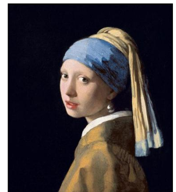
Vermeer: Pigen med Perleøreringen. 1665. Mauritshuis

og de gamle mestre i det nyligt renoverede, imponerende Rijksmuseum, den anden dag er det Van Gogh Museum, der er på programmet. Også Haag besøges vi en dag og nyder Mauritshuis med den fornemme perlerække af mesterværker, hvor især Rembrandt og Vermeer (Pigen med Perleøreringen) er velrepræsenterede med berømte malerier. Midt i ugen tager vi på heldagstur til Unesco-verdensarvsbyen Brugge i Belgien , byen, der er priset for sin store betydning i 1400-tallet og idylliske, velbevarede