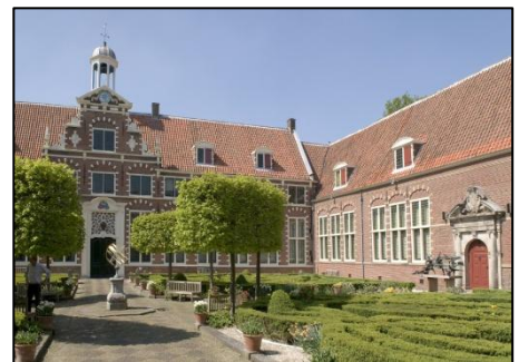
Frans Hals Museum, Haarlem

Efterårsrejsen fra 26.september til 2. oktober går til Nederlandene , med en afstikker til Belgien . Vi vil alle dage bo i overskuelige, historiske Haarlem med museet for den livfulde 1600-tals- portrætmaler Frans Hals i en velbygget fattiggård fra 1600-tallet. En hel dag er helliget Haarlem, hvor også byens Grote Kerk, den imponerende, store katedral, skal besøges. Fra Haarlem tager vi to af dagene den korte vej til Amsterdam , den ene dag står på Rembrandt