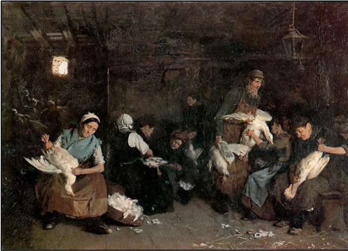
Max Liebermann: Gåseplukkerne. 1871

Max Liebermanns (1847-1935) livsperiode spænder rundt om den tyske kunsts og histories store moderne fortælling og danner rammen om foredraget. Som kunstner spændte Liebermann fra naturalisme til impressionisme. For kunstlivet var han af uvurderlig betydning med sin promovning af de nye strømninger fra Frankrig. Han og de kunstnere, han gik i generation med, især Lovis Corinth og Max Slevogt, tegnede den tyske malerkunst omkring år 1900.